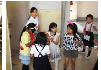
4-2「中校舎の果てまで行ってQ」