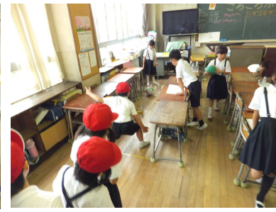
2-4「ころころボーリング」