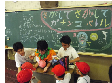
6-2「さがしてさがして ガチンコバトル」