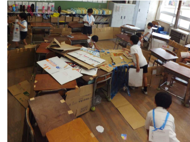
2-1「ほう石しかけめいろ」