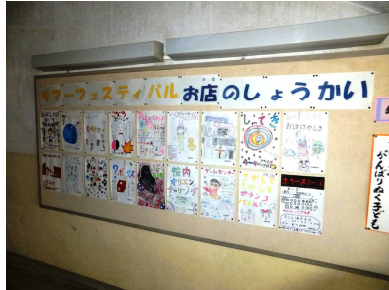
ポスターでアピールしました

6月21日(木)に、サマーフェスティバルが行われました。2年以上の各クラスが、代表委員会で話し合って割り当てられた内容・会場でお客さんに楽しんでもらおうと、一生懸命に準備を重ねました。どのクラスも工夫をこらして、お客さんを迎えていました。1年生も、初めてのサマーフェスティバルにワクワクしながら、たくさんの会場を回って楽しんでいました。