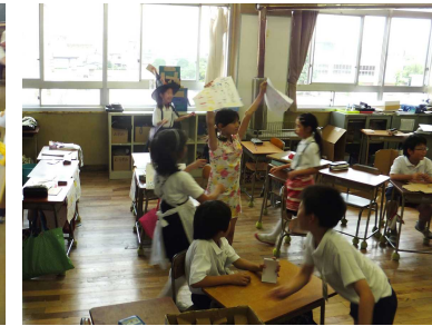
4-1「ゲーム&クイズランド」