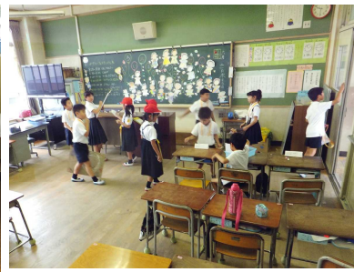
2-3「いろいろキャラクターさがし」