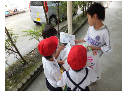
5-2「校内オリエンテーリング」