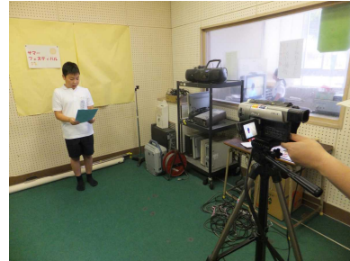
開会式(テレビ放送)